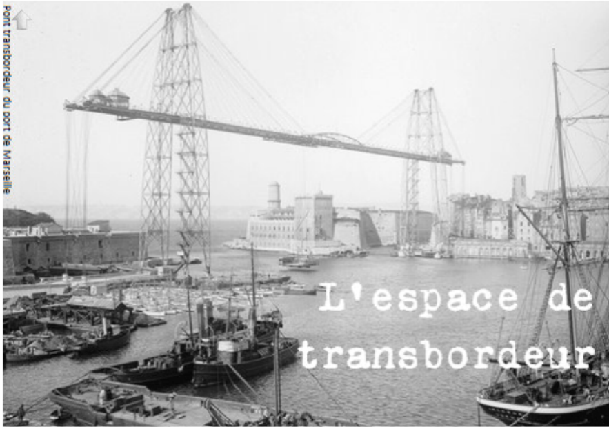
Pont transbordeur du port de Marseille

Steunpunt thuislozenzorg brussel Centre d'appui au secteur bruxellois d'aide aux personnes sans-abri